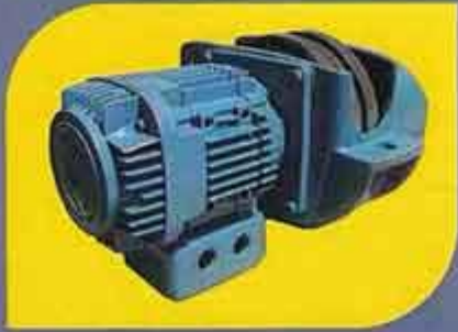
الکترو موتور کیریئرس مخصوص KBK