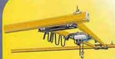
ریل KBK بصورت دو ریل LOW