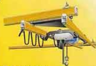
ریل KBK بصورت آویز