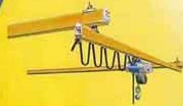
ریل KBK بصورت تک ریل