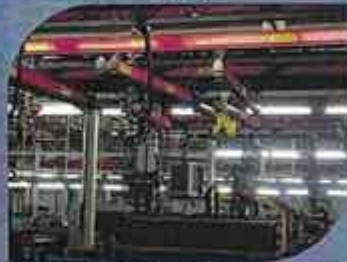
قالب های پیشرفته ایران خودرو