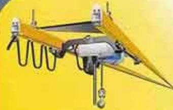
ریل KBK بصورت تک محور