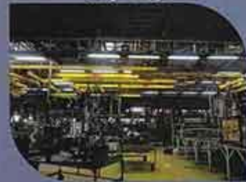
تهراس خودرو B90