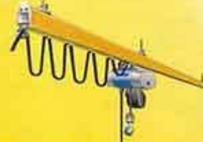
ریل KBK بصورت موتور ریل