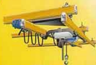
ریل KBK بصورت سه لاین